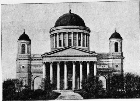
Ecclesia Cathedralis Strigoniensis.