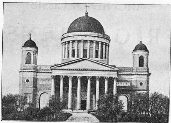
Ecclesia Cathedralis Strigoniensis.