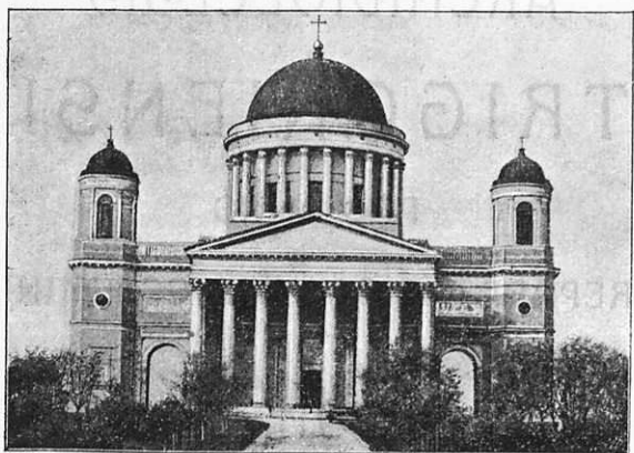
Ecclesia Cathedralis Strigoniensis.